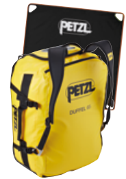
DUFFEL BAG 65 I Rucksack + Seilplane