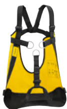
PITAGOR Rettungsdreieck Art.-Nr.: C060AA00

Optional, nicht im Set inbegriffen, separat bestellen: