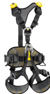
AVAO BOD FAST Auffang- + Haltegurt