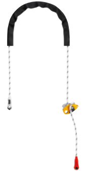
GRILLON 2 m längenverstellbares Verbindungsmittel