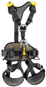
AVAO BOD FAST Auffang- + Haltegurt