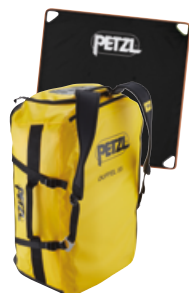
DUFFEL BAG 85 l Rucksack + Seilplane